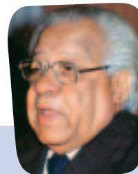
Nicolás GUILLÉN (1902-1989)

Poeta cubano de padres mulatos, se convirtió pronto en el representante más destacado de la poesía afrocubana. Destacan en su obra West Indies, Ltd. (1934) y Tengo (1964).