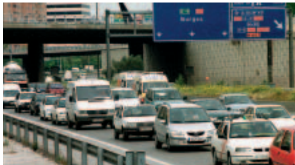
Autovía de circunvalación de Madrid