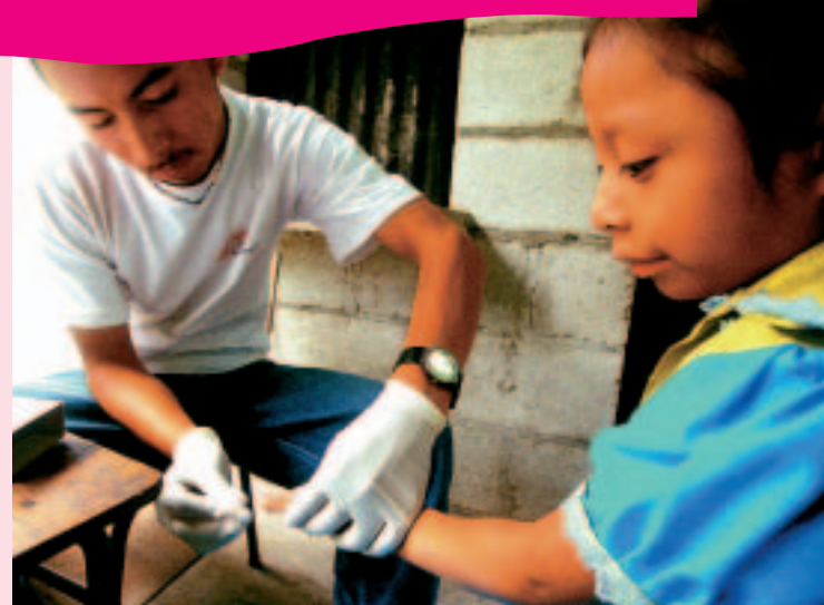
Médicos Sin Fronteras en Guatemala