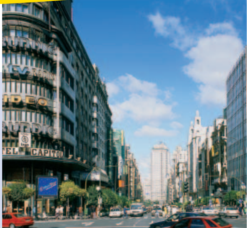
La Gran Vía en Madrid

MARÍA ANTONIA TRUJILLO RINCÓN (ministra de Vivienda), El País , 03/10/05