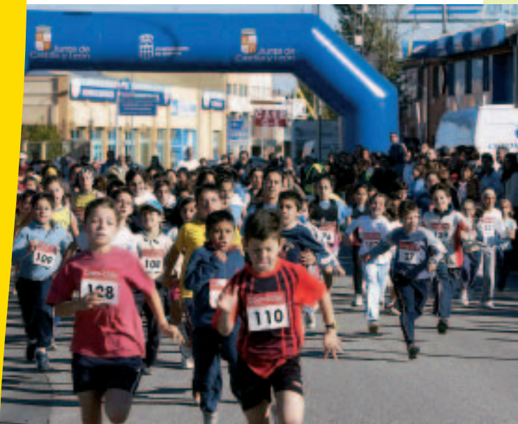
Solidaridad en Castilla y León: carrera para conseguir dinero