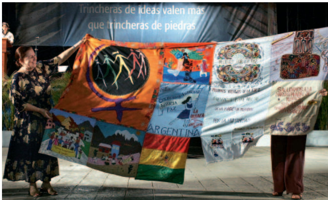
Manta de la Solidaridad