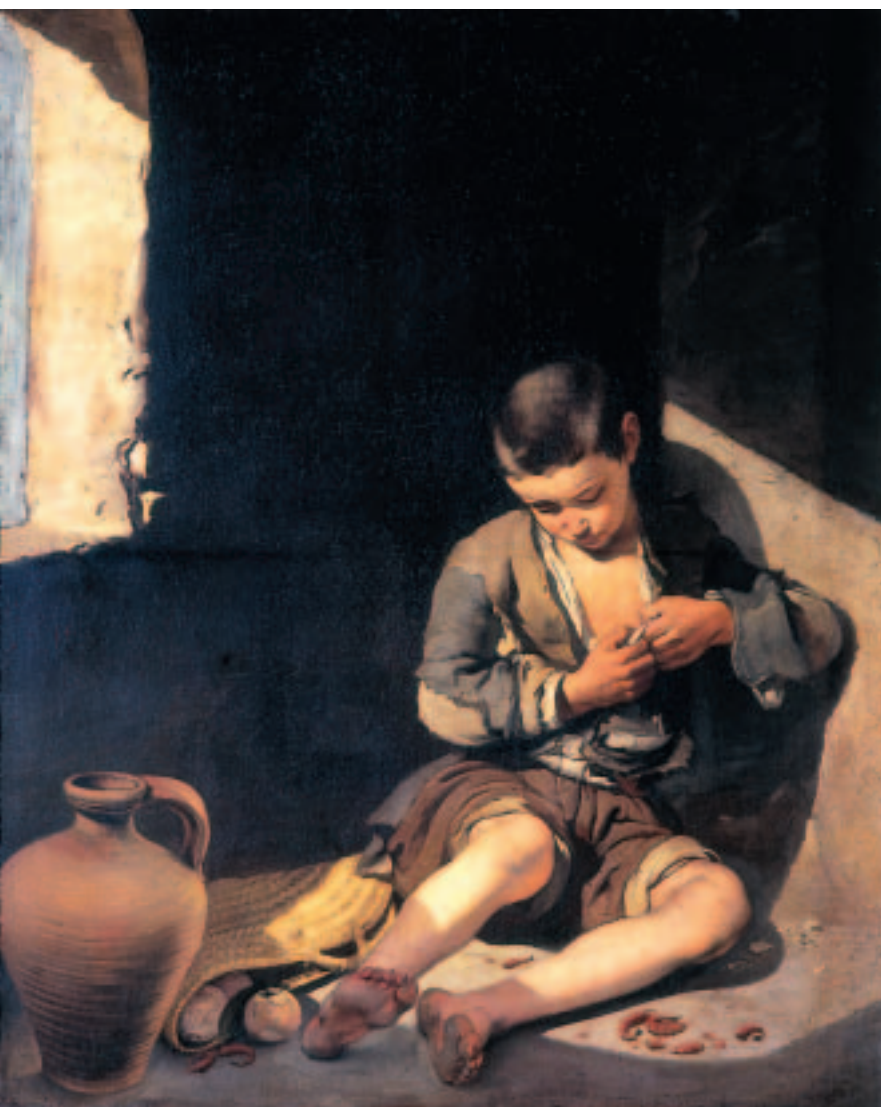
Bartolomé Esteban MURILLO (pintor español), El joven mendigo , 1650