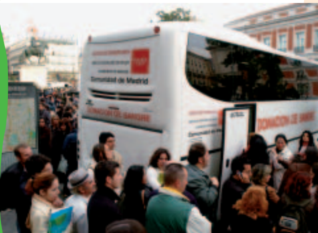
Donación de sangre en Madrid