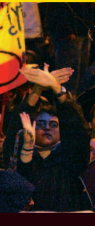
2 Manifestación por la paz después de los atentados en Madrid (11/03/2004)