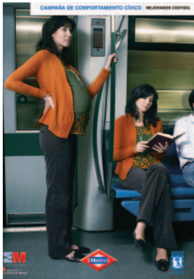
Carteles del metro de Madrid, 2005