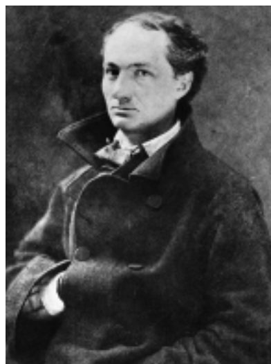
▲ Charles Baudelaire photographié vers 1855 par son ami Nadar.