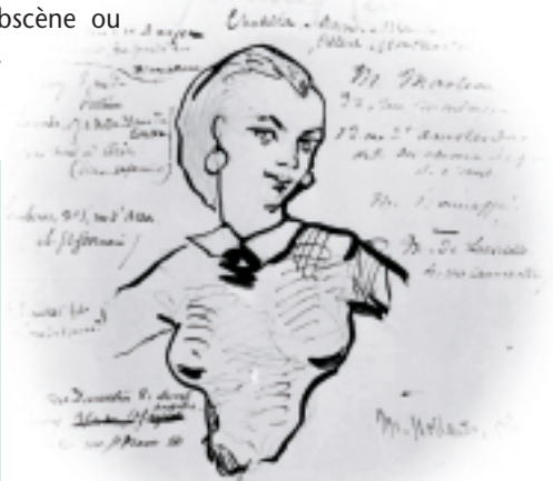
▲ Jeanne Duval, inspiratrice de nombreux poèmes des Flours du mal . Dessin de Baudelaire.

Le soir même du verdict, Baudelaire apparaît dans une brasserie parisienne en « toilette de guillotiné », portant une chemise sans col et les cheveux rasés. Il éprouve un profond sentiment d'injustice qui ne le quittera plus. La seconde édition des Flours du mal lui permet d'ajouter de nouveaux poèmes au recueil, mais Baudelaire se sent incompris par le public et rejeté par la société. Il faut attendre la mort du poète, en 1867, pour que le livre rencontre le succès et soit reconnu comme un chef-d'œuvre. En 1949, la cour de cassation annule la condamnation des Flours du mal , considérant que les poèmes « ne renferment aucun terme obscène ou même grossier ».