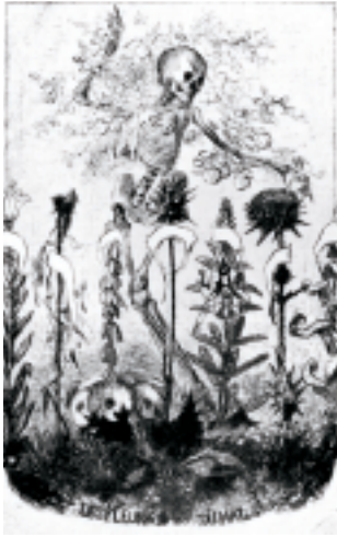
▲ Illustration de Félix Bracquemond pour l'œuvre de Baudelaire.