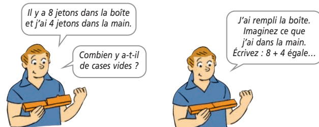
Phase d'anticipation (début).

Mais les situations d'anticipation utilisées dans J'apprends les maths CE1 favorisent l'apprentissage du calcul mental pour une autre raison, plus fondamentale encore. Considérons, par exemple, la situation utilisée pour enseigner le « passage de la dizaine » : 8 + 4 = (8 + 2) + 2 .