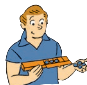
Phase de validation : l'enseignant reconstitue la situation initiale tout en basculant la boîte et en ouvrant la main. Il peut ensuite réaliser l'action de manière visible.

Les élèves sont conduits à simuler mentalement l'action que l'enseignant a réalisée de façon masquée. Or, les recherches en neuropsychologie 5 montrent que l'apprentissage repose grandement sur ce type de processus mentaux. La phase de validation s'effectue ainsi :