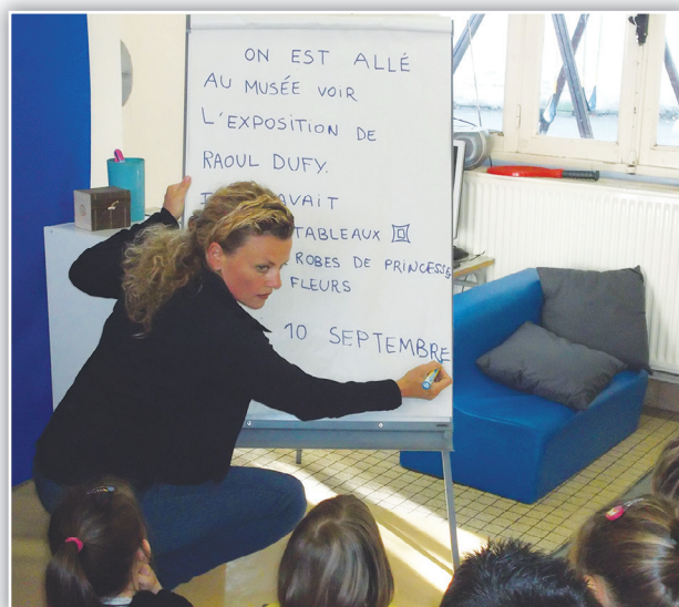
Dictée collective suite à une sortie au musée.

Son rôle dans cette activité est très important : l'enseignant veille à l'authenticité des situations qu'il propose. Il doit y avoir un véritable destinataire, un lecteur identifié, une fonction précise à l'écrit.