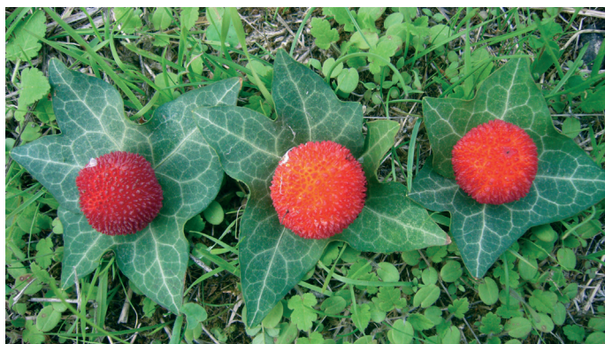
Land Art in situ : œuvres d'art créées dans et avec la nature, p. 48.