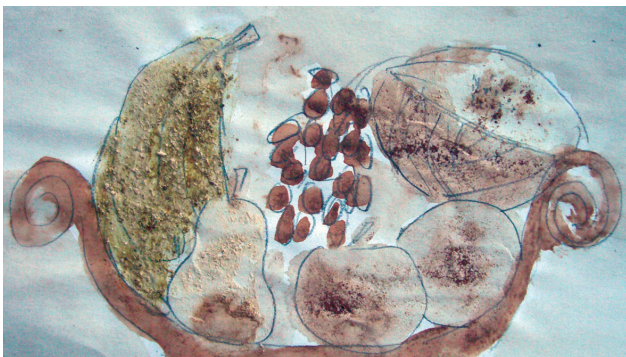
Recettes pour petits peintres un peu sorciers : croquis coloré avec des épices, p. 41.