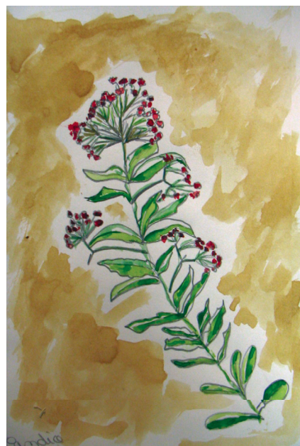
Portrait végétal : dessin de fleur colorisé à l'encre et au café, pp. 45 et 51.