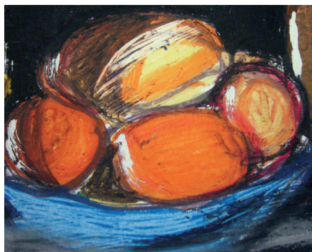
Croquis d'étalage colorisé à l'encre et à la craie grasse, p. 40.