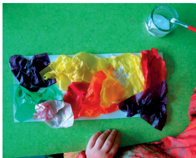
Celui-ci a froissé du papier.