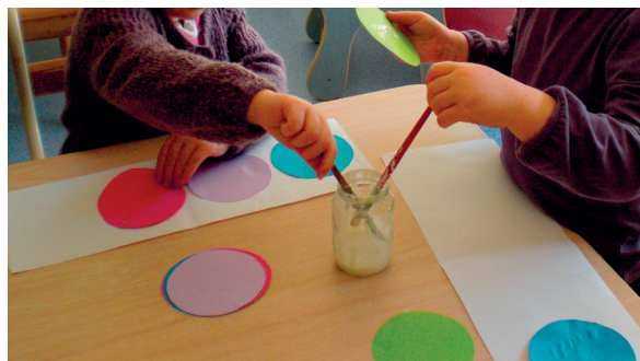
Mauvaise préhension du pinceau : à corriger impérativement.