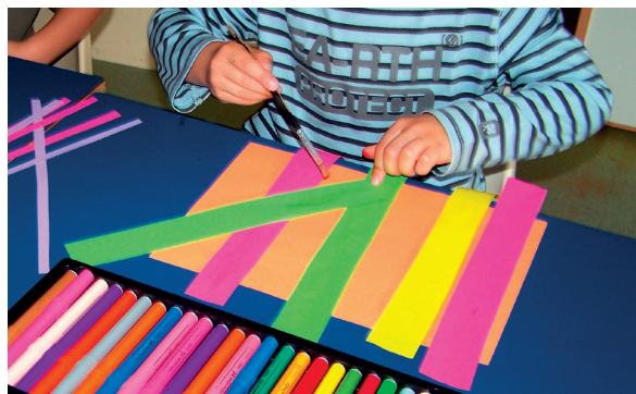
Bonne préhension du pinceau.