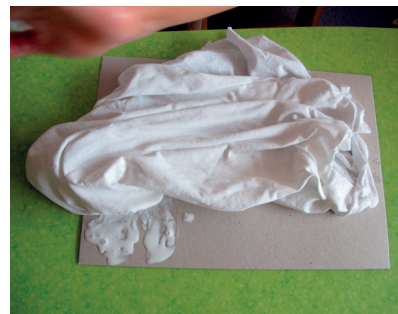
Ici, l'enfant colle du tissu avant de le peindre.