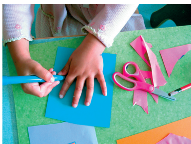
Cet autre se sert de sa main comme gabarit.