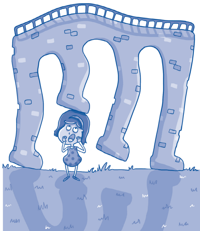
Le monde à l'envers, in Rabute et Clignette , William Brighty Rands, © Éditions Plein Chant.

La rue se promène dans les hommes, Les ratures effacent la gomme La table se cache sous le chat La caserne s'ennuie dans le soldat ; Le pont passe sur la petite fille, Le cocon tisse sa chenille ; La lande broute le mouton, Le jardin pousse dans l'oignon ; Le poème fait naître un poète, Le marathon gagne un athlète ; La mer prend le bateau, Le sable marche sur le chameau La salle d'attente ronfle dans le poêle, Le grand jour éclate au scandale ; Le cheval pique le flanc du taon, Un arbre déracine l'ouragan ; La vache traite la fermière, Le proverbe roule dans la pierre ; La ruche quitte enfin l'essaim Le jet d'eau s'orne d'un bassin ; Les billets vérifient le contrôleur, Demain sera pour le bonheur.