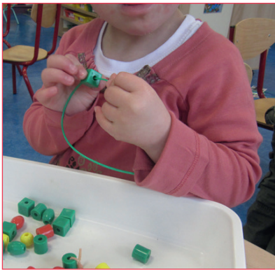
Classe de PS, école George Sand, Bussy-Saint-Georges (77). Photo qui atteste que l'élève réussit une activité en motricité fine.

parcours sans pour autant être en « difficulté », mais tous continueront de progresser par rapport à eux-mêmes.