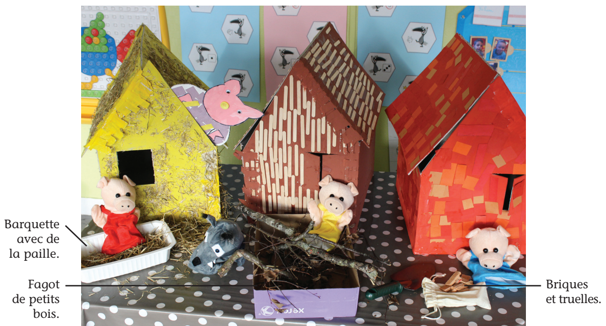
Les maisons des trois petits cochons.