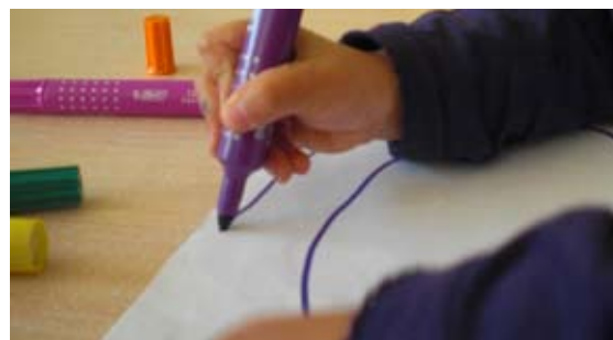
Préhension correcte de l'outil scripteur.

Les deux autres doigts sont repliés au niveau de l'articulation principale.