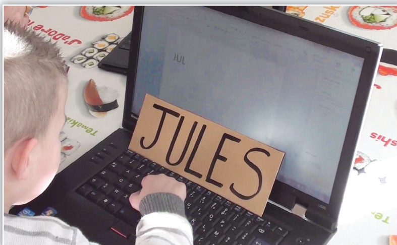
Écriture au clavier.