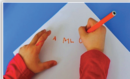
Quelques lettres du prénom.