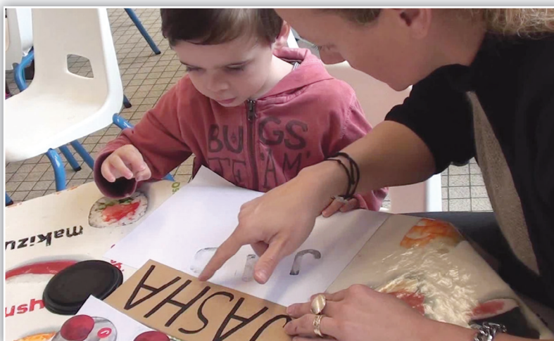
Reconnaitre, nommer et tamponner les lettres de son prénom.