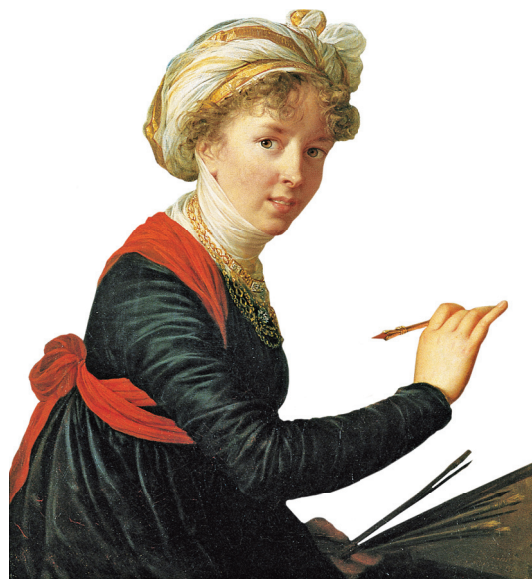
L.-É. Vigée-Lebrun, 1800