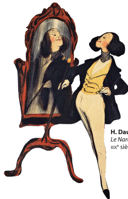
H. Daumier, Le Narcisse (mondain) , XIX e siècle