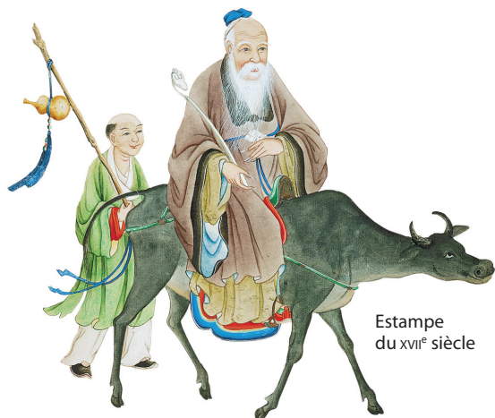
Estampe du XVII e siècle