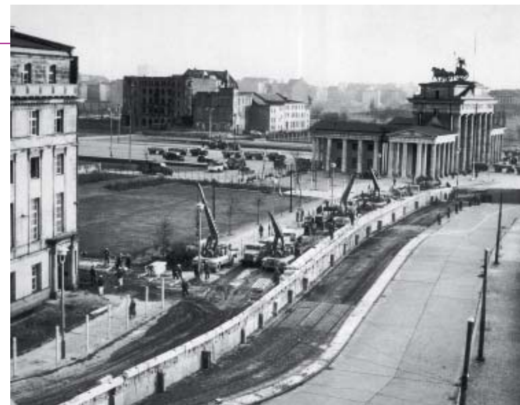
4 La construction du mur de Berlin, août 1961.

Précis d'histoire du parti communiste de l'Union Soviétique , éditions du Progrès, Moscou, 1970.