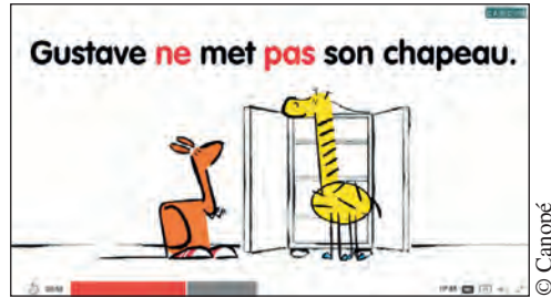
6. Animation : La phrase négative

Synthèse animée : pour compléter la synthèse, il est possible de présenter à la classe le petit film d'animation « La phrase négative », réalisé par Canopé (les fondamentaux) et disponible dans les ressources numériques.