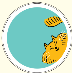
Zitoune , chat de Nadir