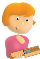
Phase de validation : l'enseignant bascule la boîte.

Il y a 7 jetons dans la boîte. Imaginez ce que je vois. Combien faut-il ajouter de jetons pour la remplir ?