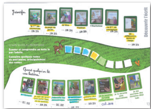
Album de Valentin, GS, classe de Valérie Bourdenet, Moissy Cramayel (77)

En fonction du moment de la journée, il est possible que le temps ne permette pas