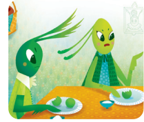
Les parents de la sauterelle