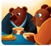
Les parents de l'ours