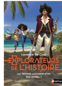
Explorateurs de l'Histoire Les femmes pouvaient-elles être pirates ? Laurence De Cock