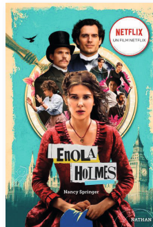
Les enquêtes d'Enola Holmes Tome 1, La double disparition Nancy Springer