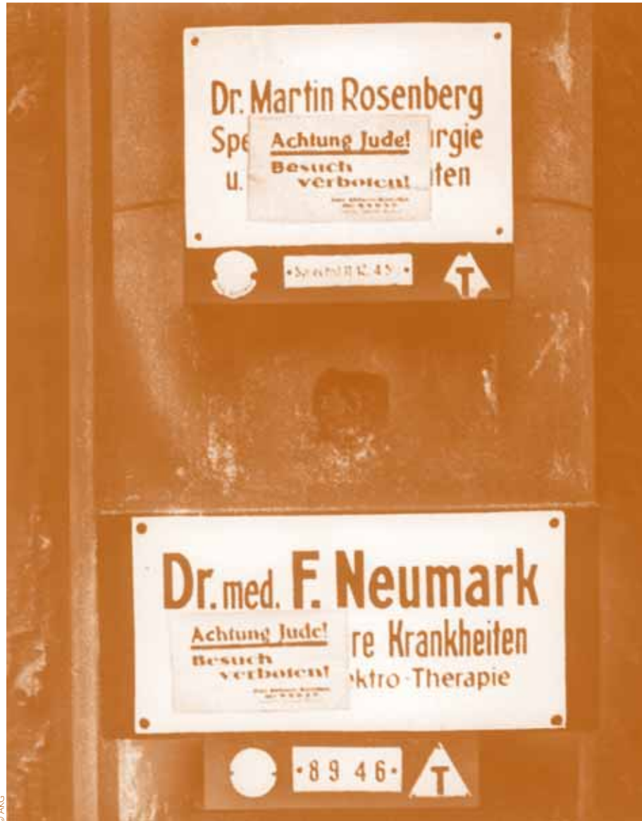
Autocollants appelant au boycott des médecins juifs en 1933 (traduction « Attention Juif ! Visite interdite ! »)