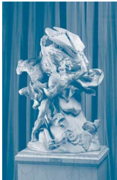
Nicolas Sébastien Adam (1705-1778) Prométhée enchaîné, marbre Musée du Louvre, Paris