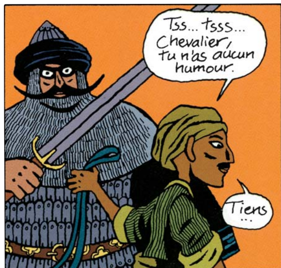
David B., Les Chercheurs de trésor , 2. La Ville froide , © Dargaud, 2004.

Comparez ces deux personnages en employant de nombreux adjectifs à des degrés variés.